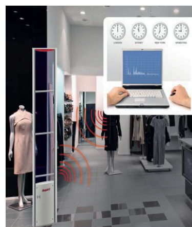
EVOLVE P30 без вставок в рекламные панели