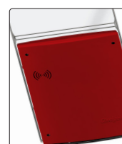
*Выше представлен рубиново-красный цвет крышки основания